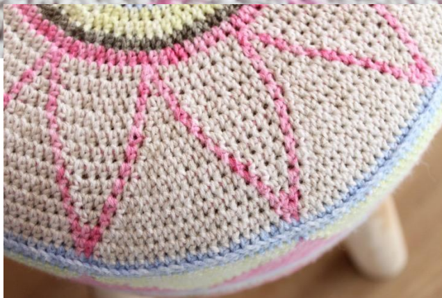
Egyptian Star Flower Krukje